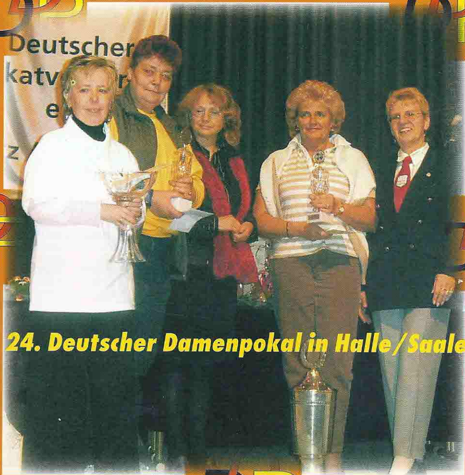
24. Deutscher Damenpokal in Halle/Saale