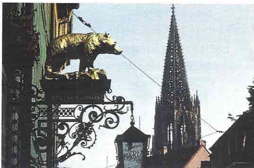
Münsterturm und Hotelschild

Ungewöhnlich vielfältig sind die Freizeitmöglichkeiten : moderne Sport- und Erholungsanlagen, Bäder und Badeseen, Parks und Gärten, ein schier unerschöpflicher Vorrat an Spazier-, Wander- und Radwegen... Man ist hier sozusagen gleich „draußen“. Freiburgs vielbesuchter „Hausberg“, der 1284m hohe Schwarzwaldgipfel „Schau-