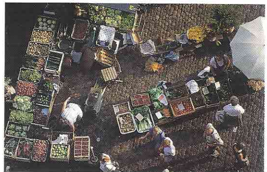
Markt auf dem Münsterplatz