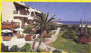
Hotel Cactus Beach ***