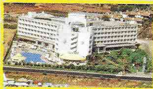
Hotel Grand Kaptan ****