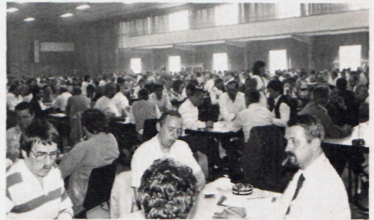
Blick auf einen Teil der über 130 Spieltische, an denen um die Punkte gerungen wurde.

die sonst nicht unbedingt bemerkt werden, deckt er sofort auf. So blieb es nicht aus, daß mehr denn je vom Lautsprecher Gebrauch gemacht werden mußte, um klären zu können, was unklar war. Die Schuld an den Durchsa-