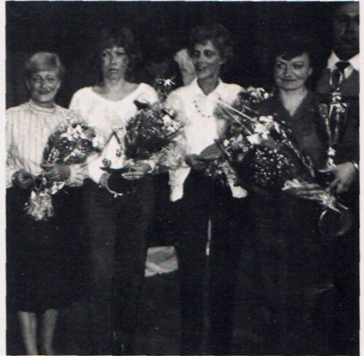
Erschöpft und glücklich zugleich die Damen der Meistermannschaft von »Waterkant« Bremerhaven.

nenen 30 verlorene Spiele auf seinem Konto hatte. Zu einigen Bagatellfällen wurden die Schiedsrichter Rolf Kämmele und Siegfried