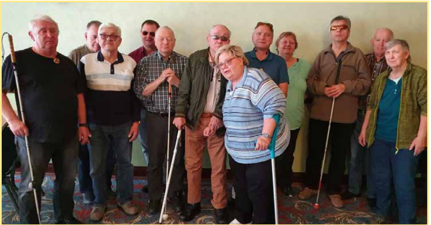
Bei der 34. Deutschen Blinden- und Sehbehindertenmeisterschaft starteten 12 Aktive. Die Teilnehmer freuten sich sehr über den vom DSKV-Ausgerichteten Wettkampf.