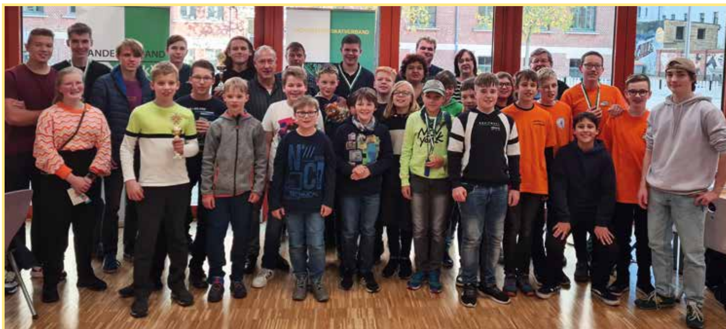
Die 12. Sächsischen Schüler- und Jugendmeisterschaften fand bei allen Beteiligten großen Anklang. Gern stellten sich die Teilnehmer und Betreuer zum Gruppenfoto auf.