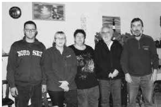
Vorstand Karo As St. Michaelisdonn

Der Clubabend findet jeden Dienstag ab 19:30 Uhr statt.