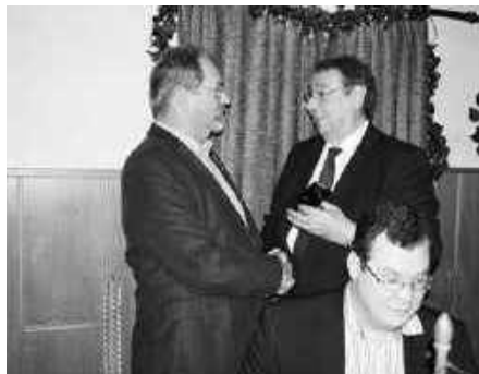
Ehrenmitglied Karo 7 Marne