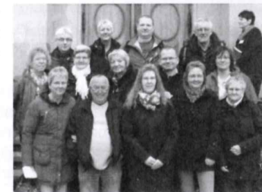
Die Reisegruppe zum DDP 2017 in Dresden vor dem Eingang der Frauenkirche kurz vor der Kirchenführung