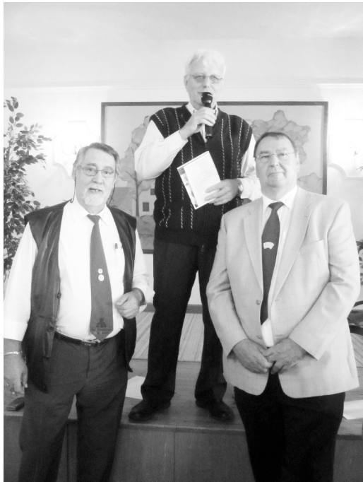
Bei der Begrüßung der Skatspieler aus Nah und Fern