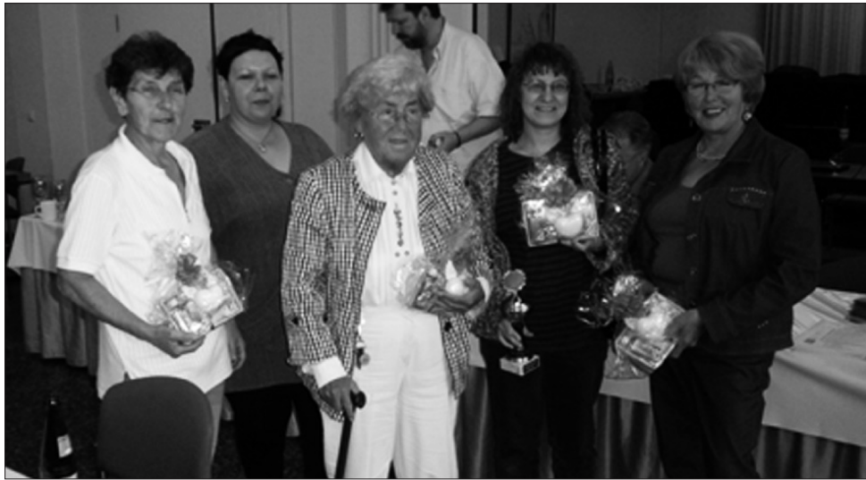
SC Wandsetal VG21 Hamburg