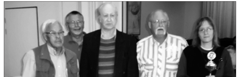
Herz As Neumünster 2 VG22 Kiel