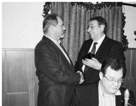
Ehrenmitglied Karo 7 Marne