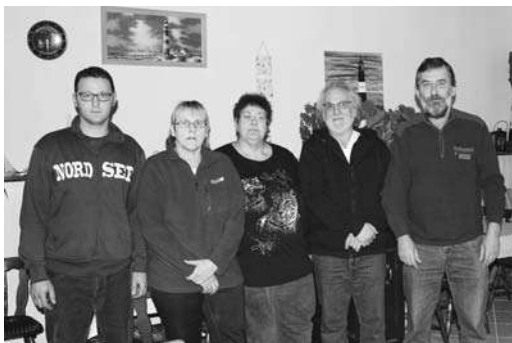
Vorstand Karo As St. Michaelisdonn

Der Clubabend findet jeden Dienstag ab 19:30 Uhr statt.