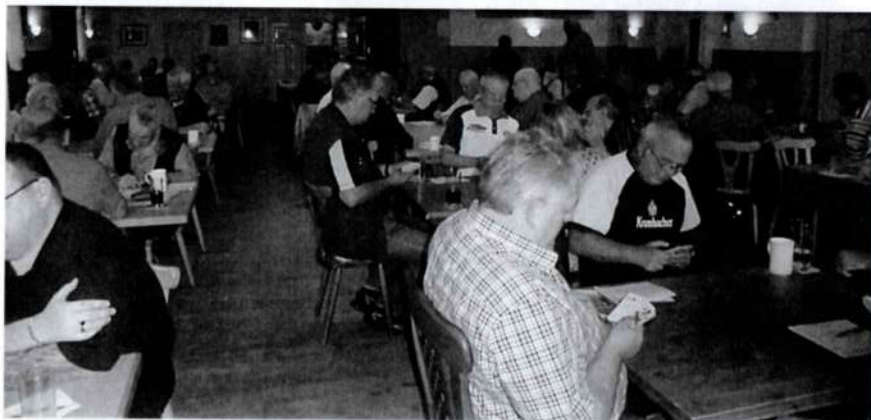
Und los geht es in Achtrup.

Normalerweise berichten immer die Veranstalter von ihren Turnieren, selten, dass einmal ein „Gast“ die Feder in die Hand nimmt. Da dies aber jetzt einmal geschehen ist, wollen wir beide Artikel einmal gegenüber stellen.