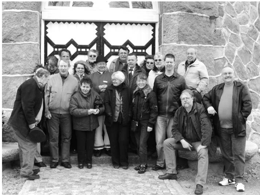
Die Schlossbuben Ossenberg aus Rheinberg beim Besuch des Heider Wasserturms