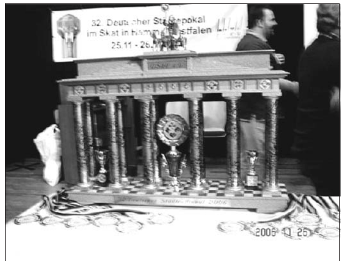
Der Deutsche Städtepokal in Form des Brandenburger Tores