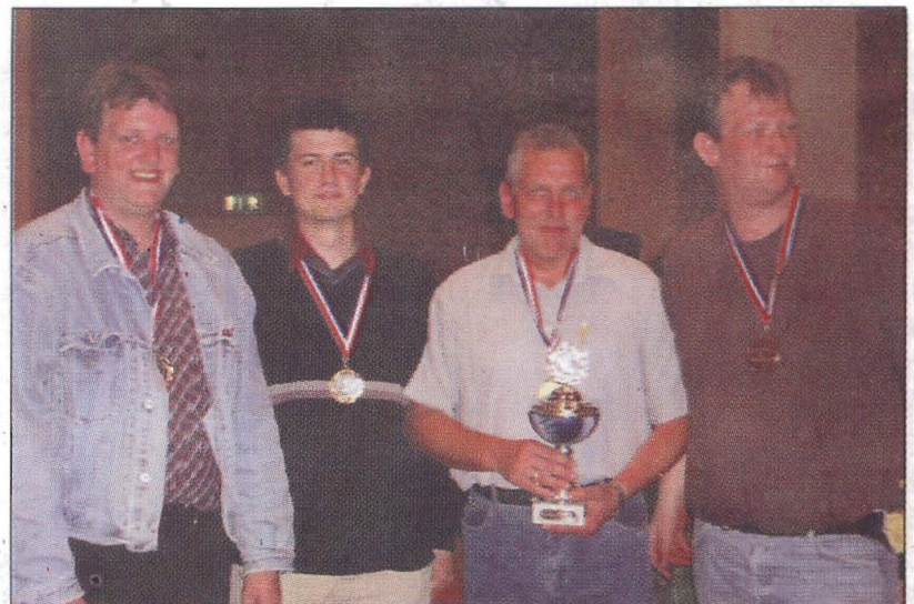
Mannschaftssieger SC Neustadt