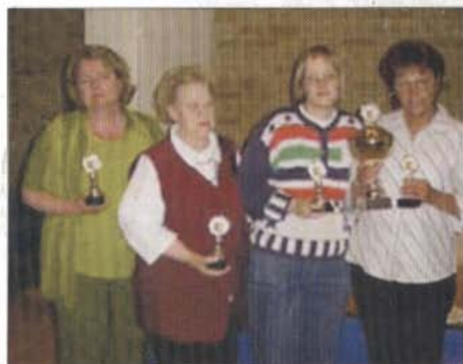
Damen MM: Herz As Neumünster (VG Kiel)

DSJM 2004 5. Platz im Mannschafts- wettbewerb der Jugendlichen