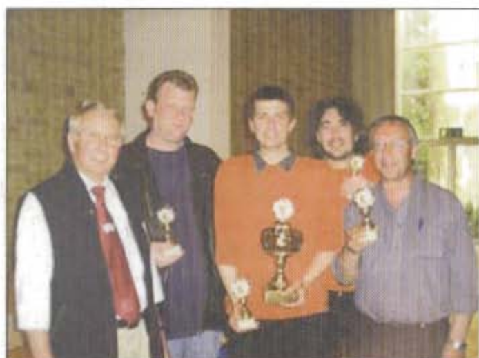
Herren MM: 1. SC Neustadt (VG Lübeck)