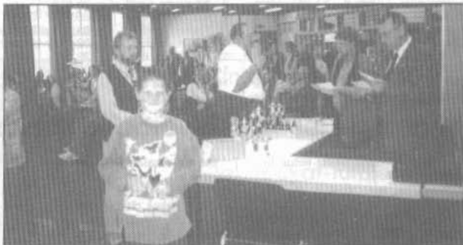
Die Jüngsten waren die "Erfolgreichsten"