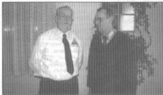
Die beiden Präsidenten des Schleswig-Holsteinischen und des Dänischen Skatverbandes im vertragen Gespräch.