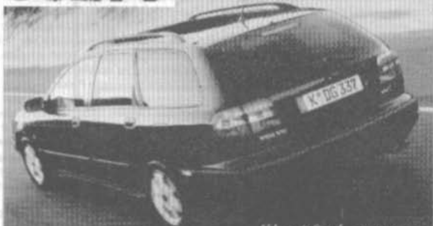
Abb.: mit Sonderausstattung.

SCHÖNHEIT IST KÄUFLICH: VOLVO V40 AB DM 299,-*