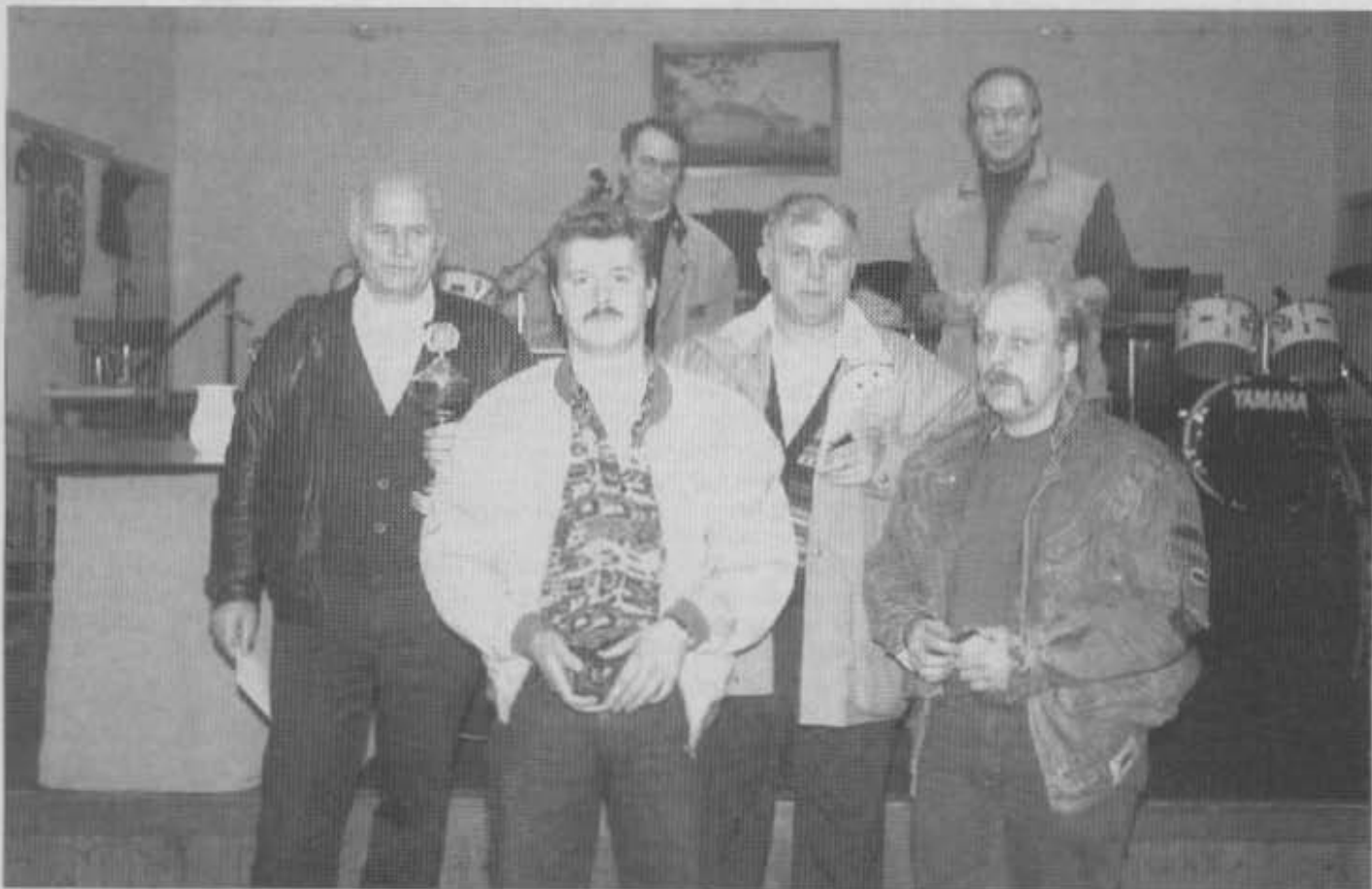
Die Mannschaftssieger von den Skatfreunden Neumünster.