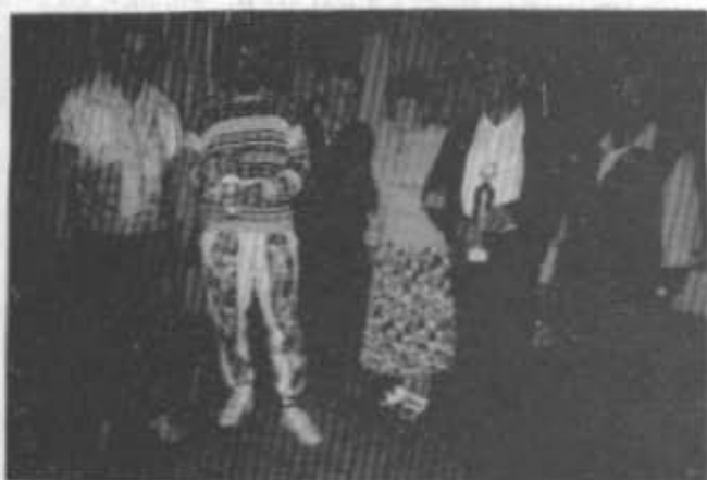
Das Ergebnis der Spielrunden der ersten 5 Plätze.