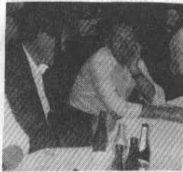
Der hochmotivierte 4. Mann