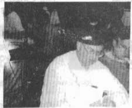
Bei so'nem Blatt kann einem glatt der Hut hochgehen