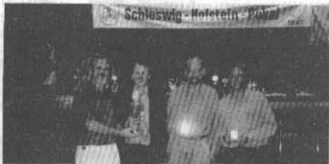
Vahrer Buben mit schleswig-holsteiner Verstärkung