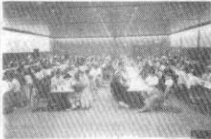
Alle Skatler konzentriert bei der Sache