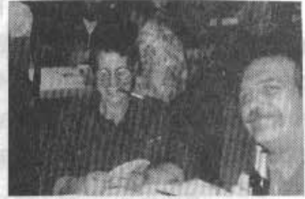
Bei solch einem Blatt würde ich mich auch freuen . . .