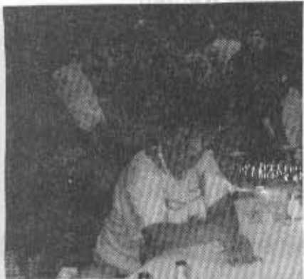
Ob der Talisman geholfen hat?