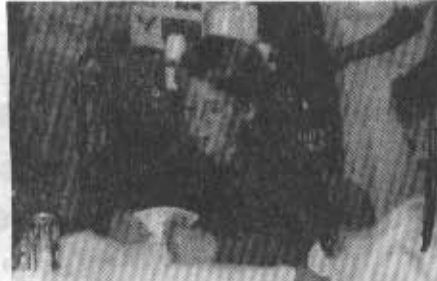
Auch die Jugend hatte manches Ass im Ärmel