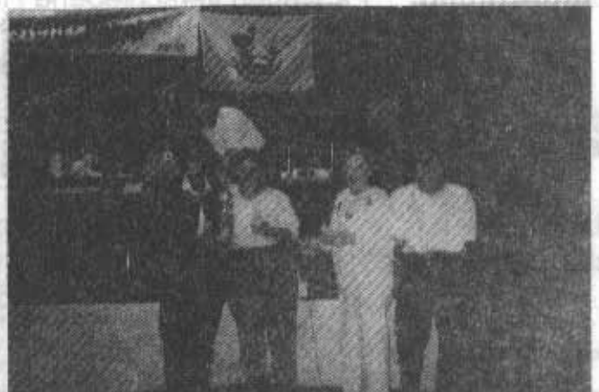
2. Siegermannschaft Joker 78