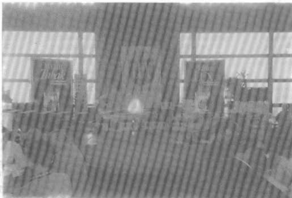
Auf diesem Foto sehen Sie eine reichhaltige Auswahl der Firma Lux-Filter.

Leider konnten wir vom Sieger kein Foto bringen, da die Preisverteilung erst um 21.15 Uhr begann.