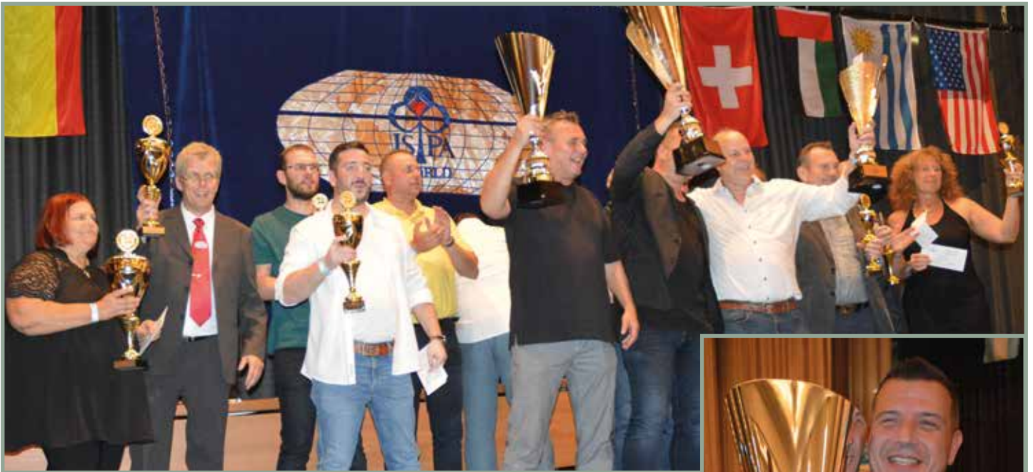
Die 16 Finalisten wurden bei der feierlichen Siegerehrung der ISPA-World alle auf die Bühne gerufen und besonders geehrt.