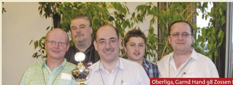
Oberliga, Garnd Hand 98 Zossen I