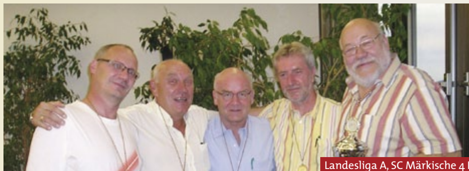
Landesliga A, SC Märkische 4 I