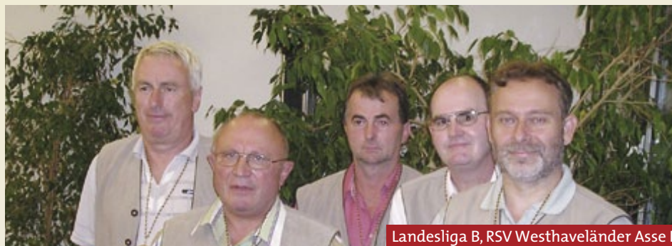
Landesliga B, RSV Westhaveländer Assel I