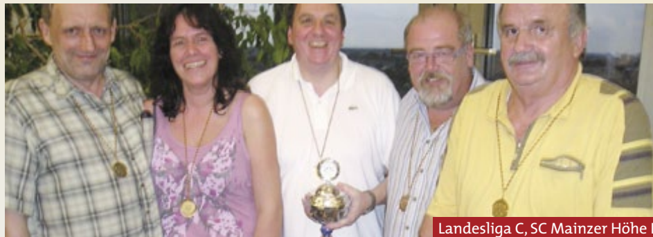
Landesliga C, SC Mainzer Höhe I