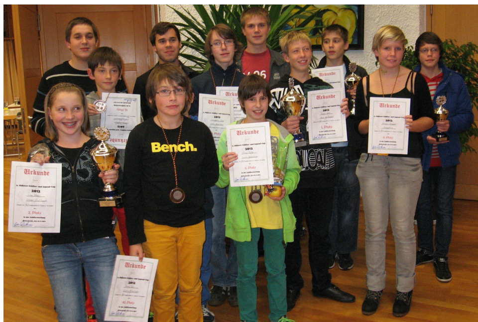
Die Teilnehmer des Südwest-Schüler- und Jugend-Cups 2012