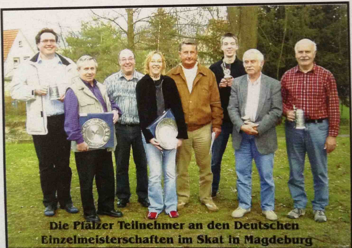
Die Pfälzer Teilnehmer an den Deutschen Einzelmeisterschaften im Skat in Magdeburg