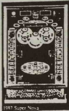
1987 Super Nova

Herbert Röhrig Automaten Schillerplatz 2 6701 Maxdorf