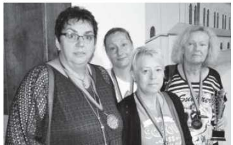
Skatfreunde Broekhuysen Straelen