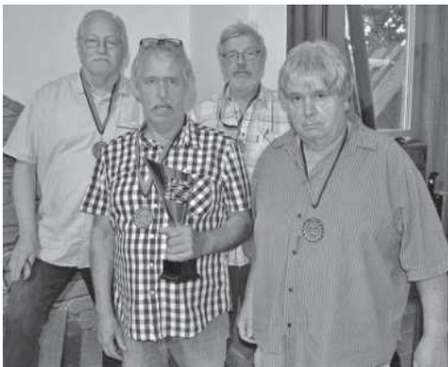
3. Platz Herren