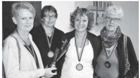
2. Platz VG 44 Damen