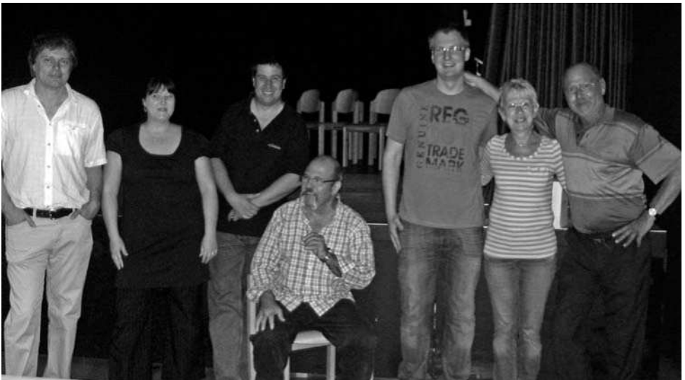
Die Einzel- und Mannschafts-Sieger beim diesjährigen RWT-Turnier