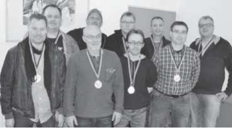
KREIS SOEST II