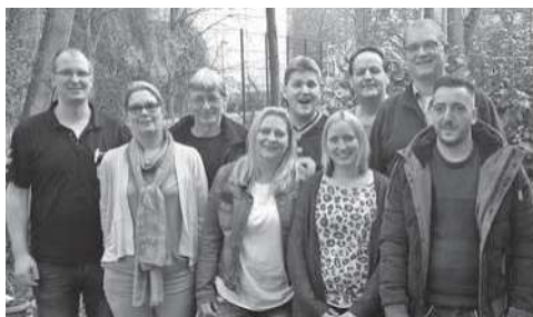
KIEPENKERL MÜNSTER I