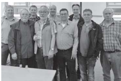
MÜLHEIM a.d. RUHR