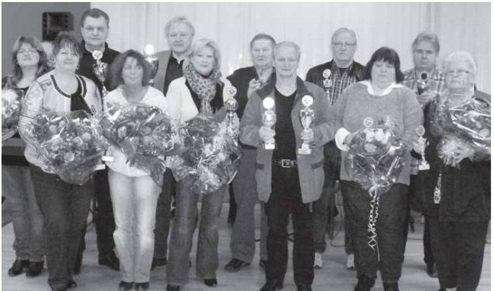
Die Jahressieger 2012 der Verbandsgruppe 41 nach der Ehrung.