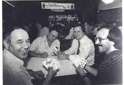
»Wer das beste Blatt hat? Na, dann wollen wir doch einsehen, wer am weitesten reizen kann!«

Dank gebührt auch dem Team Ott, das in bewährter Weise wieder den Computer nebst Drucker bediente und damit zum reibungslosen Veranstaltungsverlauf beitrug.