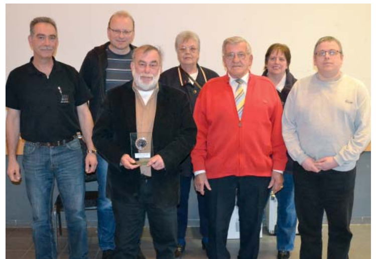
Die siegreichen Teams aus Witten (l.) und Bad Sassendorf bei der Vorrunde mit 8 Mannschaften in Soest.