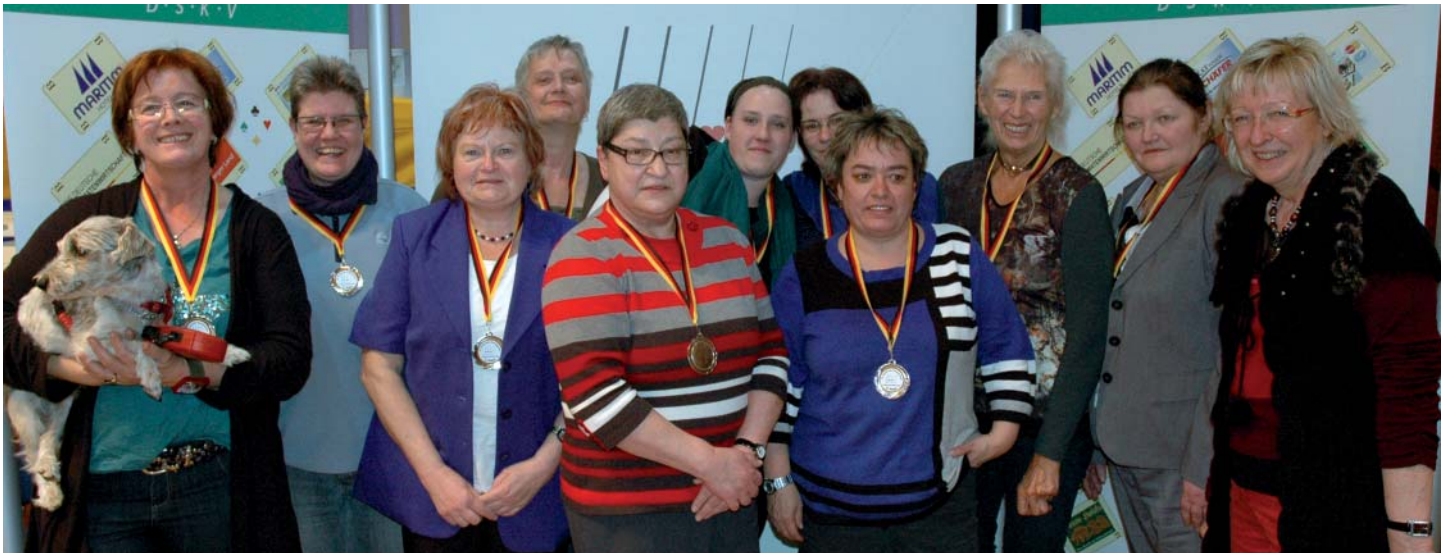
Als gute Gastgeberinnen wird den Gästen der Vortritt gelassen. Der Landesverband Bayern belegte Platz zwei in der Länderwertung, lag 1.729 Punkte hinter dem Siegerteam.