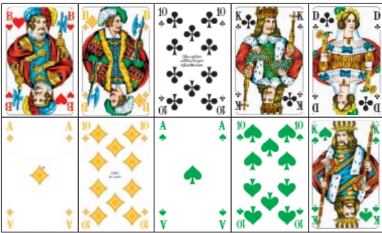
(Kartenbild: Herz B, Karo B, Kreuz 10-K-D, Karo A-10, Pik A-10-K)