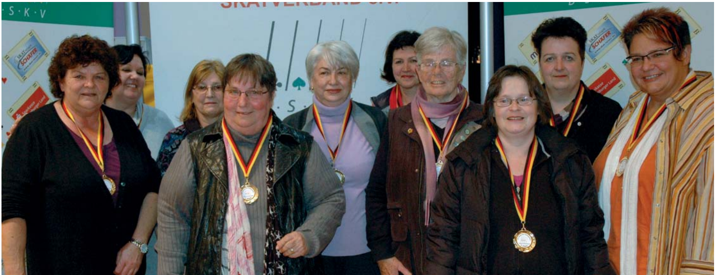
Nicht zu schlagen war der Landesverband Baden Württemberg. Die zehn besten Damen erzielten beim 33. Deutschen-Damenpokal 37.754 Punkte und gewannen somit die Länderwertung.