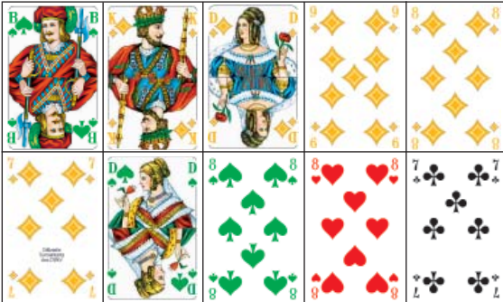
(Kartenbild: Pik B, Karo K-D-9-8-7, Pik D-8, Herz 8, Kreuz 7)