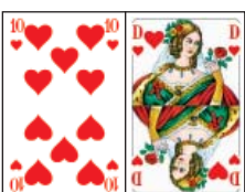
(Kartenbild: Herz 10-D)

V = Vorhand, M = Mittelhand, H = Hinterhand, AS = Alleinspieler, GP = Gegenpartei