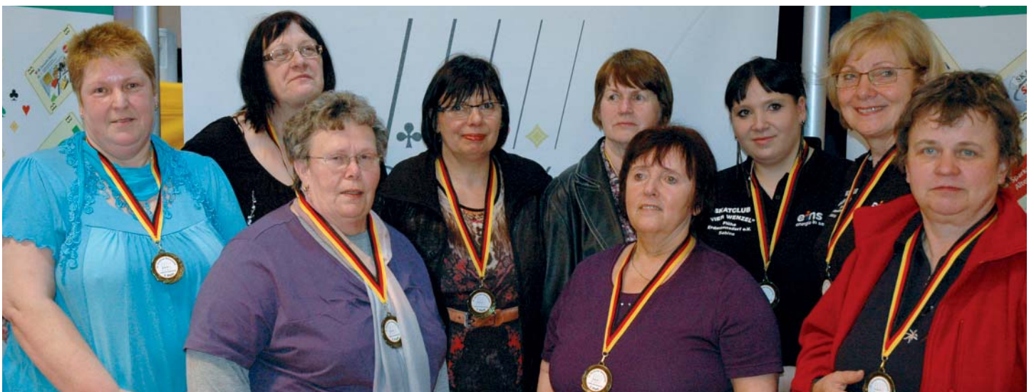
Der Landesverband Sachsen führte das breite Verfolgerfeld an, belegte mit rund 4.800 Punkten Rückstand zum Zweiten den Bronze-Platz. Der LV Hessen, nächster Gastgeber, belegte Platz sechs.